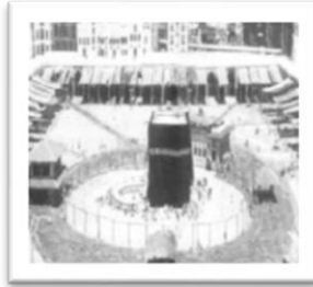
Gambar 2. Masjidil Haram pada tahun 1375 H