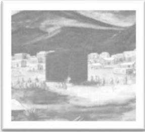
Gambar 1. Masjidil Haram pada masa Rasullullah ﷺ