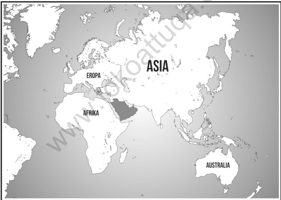
Gambar 4. Letak Jazirah Arab pada peta dunia