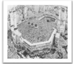
Gambar 3. Masjidil Haram pada tahun 1421 H

Aku akan memerhatikan gambar yang ada di hadapanku. Kemudian aku akan mengisi titik-titik yang kosong di bawah ini dengan jawaban yang benar.